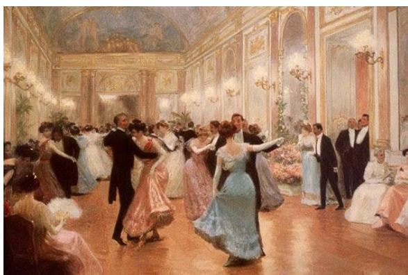
Bale karnawałowe w XIX wieku

Karnawał -to wyjątkowy czas, kiedy trwają imprezy i zabawy. Okres ten wpisuje się w rytmy natury i zwiastuje, że już niedługo zawita wiosna. Karnawał najczęściej trwa sześć tygodni. Zaczyna się po Bożym Narodzeniu a kończy Środą Popielcową, która zwiastuje nadejście Wielkiego Postu. Karnawał, jaki znamy swoje początki miał we Włoszech już w drugiej połowie XX wieku.