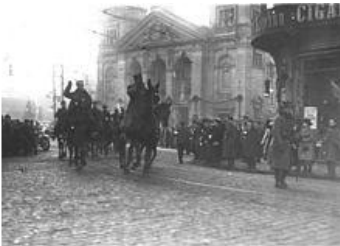
Wojsko Polskie w Bydgoszczy - styczeń 1920 rok.

* 100 – lecie powrotu Bydgoszczy w granice Polski *